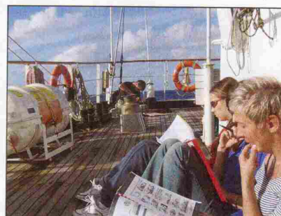
■ Koledzy poznani na żaglowcu stają się szybko dużo bliżsi niż ci znani przez lata ze szkolnej ławki

szansę na przekazanie wielu ważnych wartości. Drugim wychowawcą jest morze.