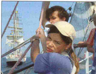
■ ... od stawiania żagli, prac bosmańskich, sprzątanía statku do udziału w wachtach nawigacyjnych